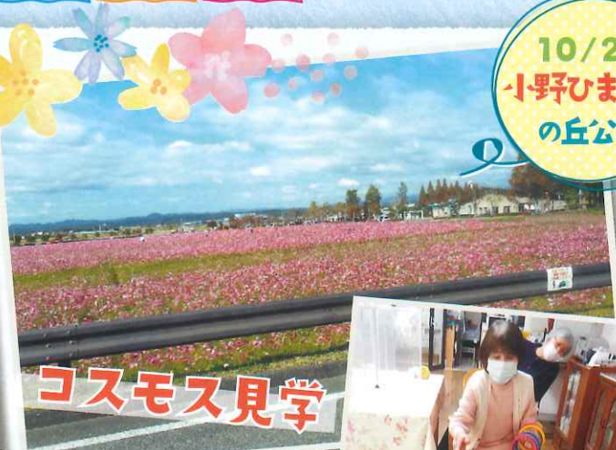
10/26 小野ひまわり の丘公園