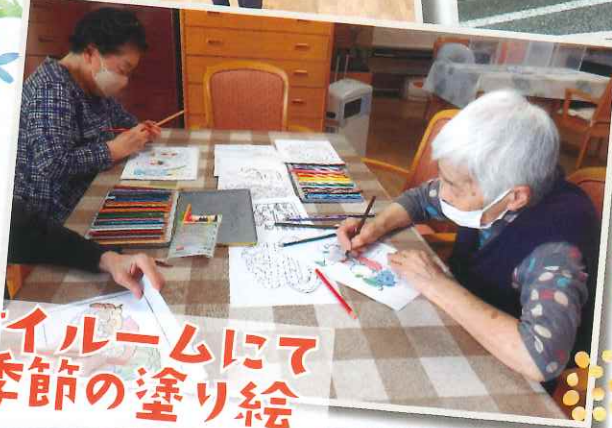
ダイルームにて 季節の塗り絵