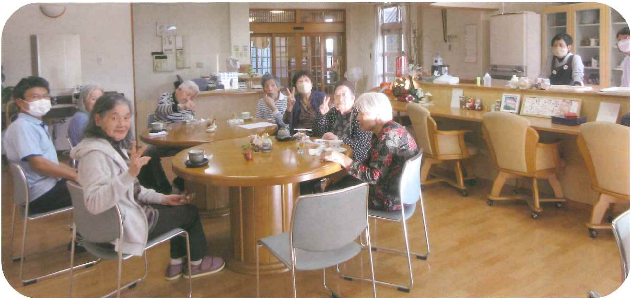
ふれあい喫茶再開

発行日 令和5年4月1日 発行者 社会福祉法人優和福祉会 発行責任者 加藤 優子 指定介護老人福祉施設 ショートステイ・ケアハウス グループホーム 居宅介護支援事業所 養護老人ホーム 優和福祉会 さつき園 三木市与呂木683-397 TEL 0794-86-1212 FAX 0794-86-0710