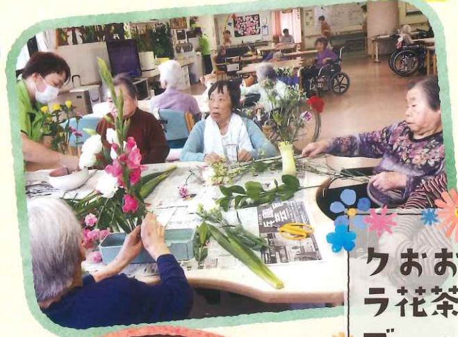
クおあ ラ花茶 ブ