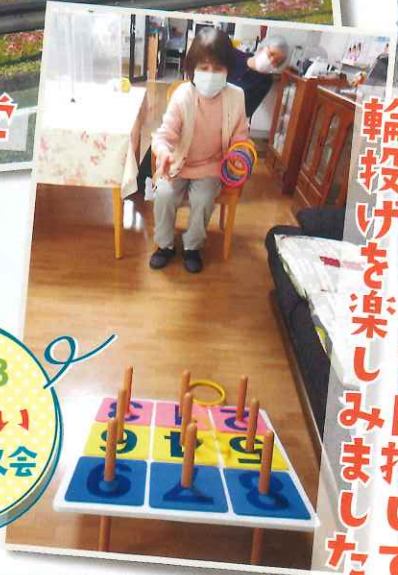
景品ゲットを 楽しまして 輪投げを楽し みました